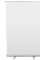
Pendón 90 x 150 cm