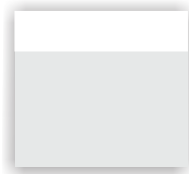
Cintillo 26,5 x 6 cm