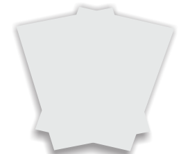
Volantes 15 x 21 cm